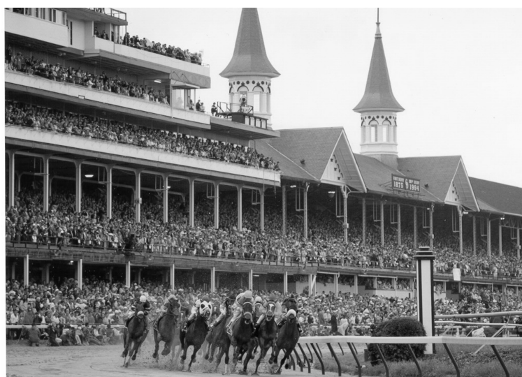
写真7 ケンタッキーダービー (Kentucky Derby) の行われるルイヴィル (Louisville) のチャーチルダウンズ (Churchill Downs) 競馬場。

現代では、競馬の中心は欧州からアメリカに移っているといつて過言でない。世界で活躍する生産馬の多くがケンタッキーを中心に、アメリカで生産されている。第一次世界大戦期に活躍し「ビックレッド (Big Red)」の愛称で国民に親しまれた「マンノー (Man'o War : USA 1917) は、100馬身差で圧勝した伝説を持つ。また二代目ビックレッドと呼ばれたセクレタリアート (Secretariat : USA 1970) は、「タイム (TIME) 誌」の表紙を飾るような国民的なスターホースであった。この他にもアメリカで生産されたスーパーホースは枚挙に止まない。