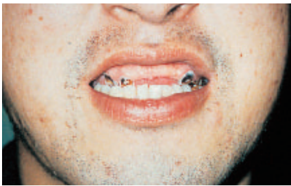
有機溶剤の乱用により腐食した歯