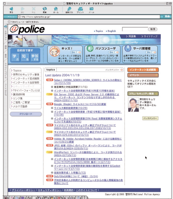
警察庁セキュリティポータルサイト(@police) http://www.cyberpolice.go.jp